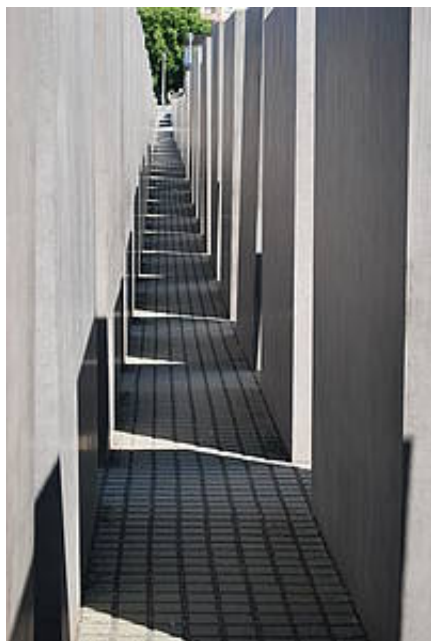
Pomnik Pomordowanych Żydów Europy / Denkmal für die ermordeten Juden Europas in Berlin