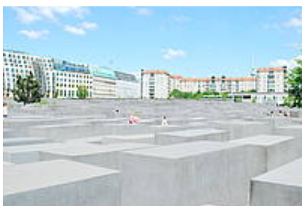
Pomnik Pomordowanych Żydów Europy / Denkmal für die ermordeten Juden Europas in Berlin