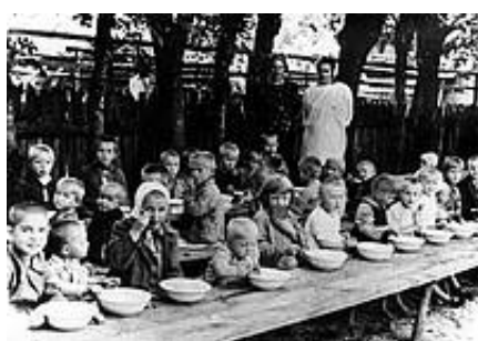
Dzieci uratowane z obozu w Zwierzyńcu