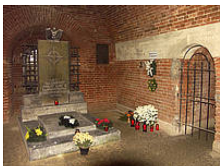
Cela Spółdzielców w Rotundzie