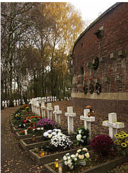
Rotunda Muzeum Martyrologii Zamojszczyzny