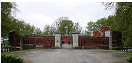
Rotunda Muzeum Martyrologii Zamojszczyzny