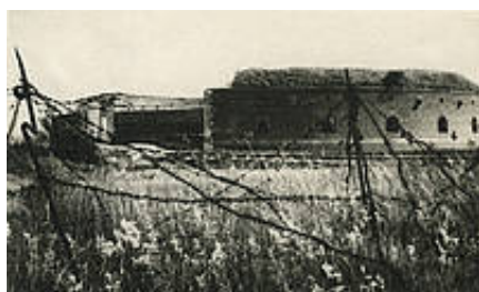
Groby wokół Rotundy 1946 rok