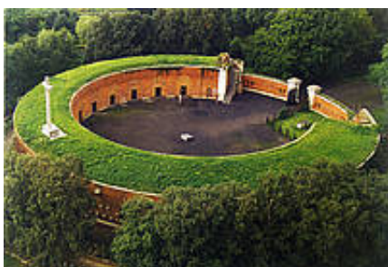
Rotunda Muzeum Martyrologii Zamojszczyzny