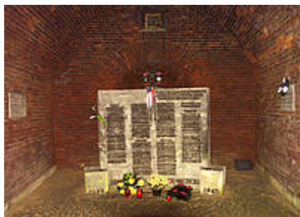
Cela Nauczycieli w Rotundzie