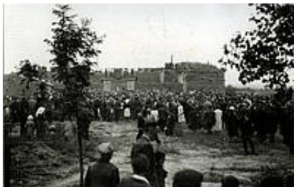
Rotunda w lipcu 1944 roku