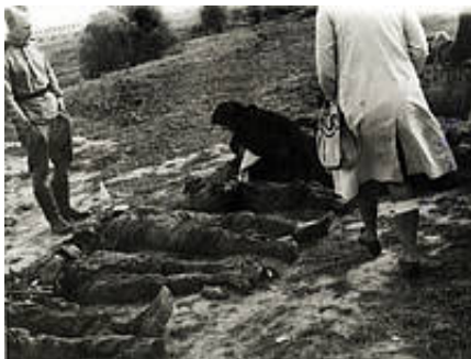
Ekshumacje przy Rotundzie 1944 rok