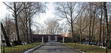
Rotunda Muzeum Martyrologii Zamojszczyzny