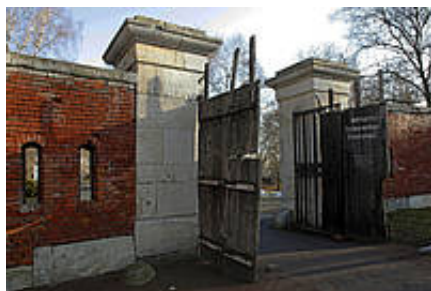
Rotunda Muzeum Martyrologii Zamojszczyzny