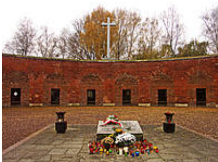
Dziedziniec Rotundy - miejsce gdzie palono ciała zamordowanych