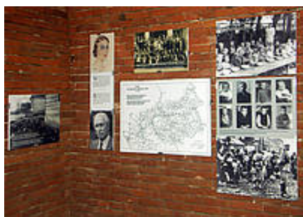
Cela ze stałą wystawą muzealną