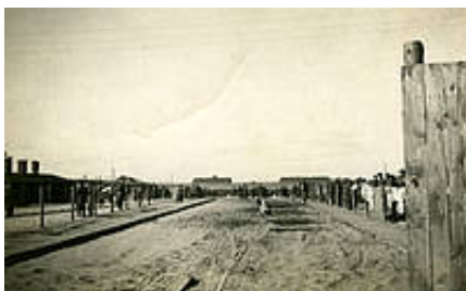
Obóz jeniecki (później wysiedleńczy) w Zamościu