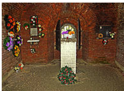
Cela więźniów Majdanka w Rotundzie