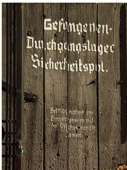
Rotunda Muzeum Martyrologii Zamojszczyzny