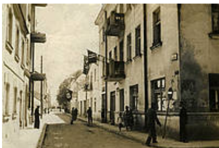
Siedziba Policji Bezpieczeństwa przy ul. Żeromskiego (wówczas Kassinostrasse)