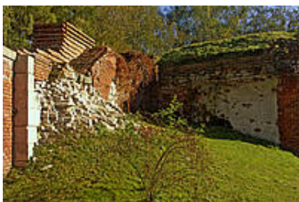
Miejsce niemieckich rozstrzeliwań