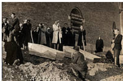
Pochówki w Rotundzie w 1944 roku