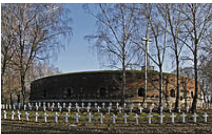
Rotunda Muzeum Martyrologii Zamojszczyzny