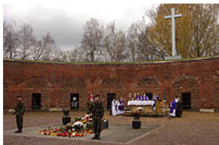
Coroczna msza 2 listopada